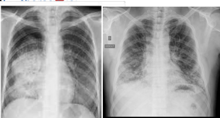
Foyer de condensation basal droit