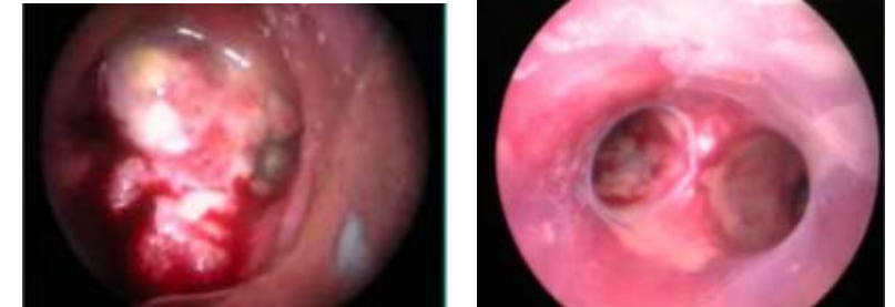
Aspect endoscopique montrant une sténose de la bronche souche droite avec inflammation de la carène

Quatre-vingt-huit pour cent (88%) des patients qui avaient un bourgeon à la bronchoscopie avaient un carcinome épidermoïde. 57% des patients qui avaient une sténose avaient un adénocarcinome. 53% des patients qui avaient une compression extrinsèque avaient un adénocarcinome.