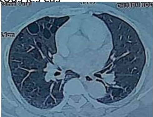
Figure 2: Poumon kystique dans le cadre de Gougerot Sjögren